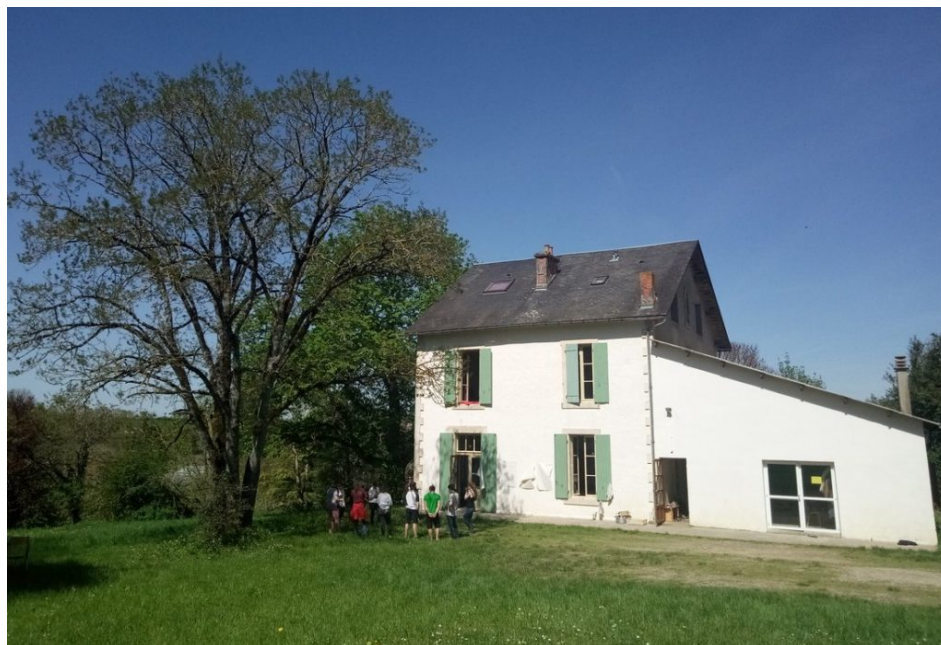
Le Carae, centre d'accueil, de rencontres et d'animations d'Exoudun