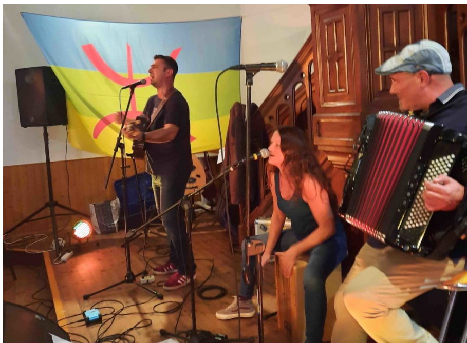
Concert de soutien pour les victimes des incendies en Kabylie - Temple protestant de La Roche-sur-Yon