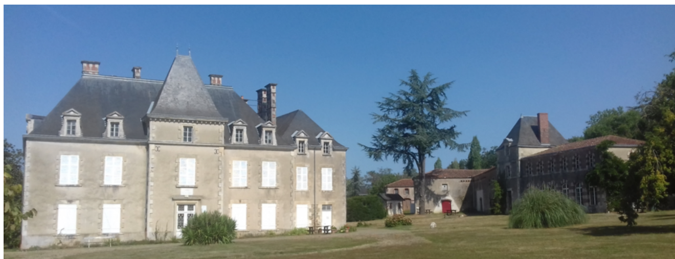
Le musée du Bois Tiffrais

Un musée vivant c'est pour les visiteurs la découverte de ses collections et du cadre dans lequel elles sont montrées. On peut penser aux conditions de classement et de conservation, au nécessaire accroissement des collections, à toute la documentation qu'un musée doit rassembler dans le cadre de son objet. Une bibliothèque et des archives en font nécessairement partie.