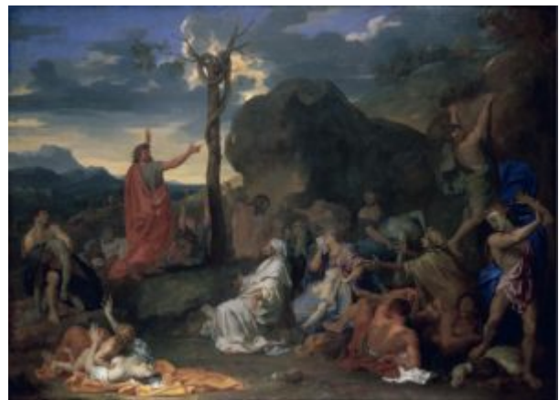
Le serpent d'Airain de Le Brun